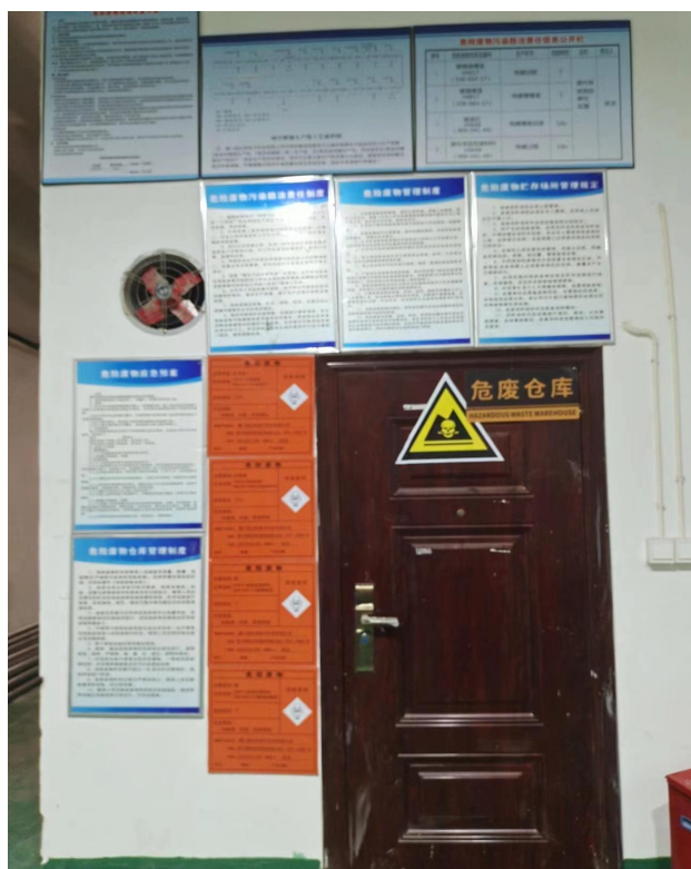
危废暂存间外已完善管理制度

整改后：①规范设置危险废物暂存仓库。②对危险废物进行分类收集贮存，规范张贴袋装危险废物小标识。