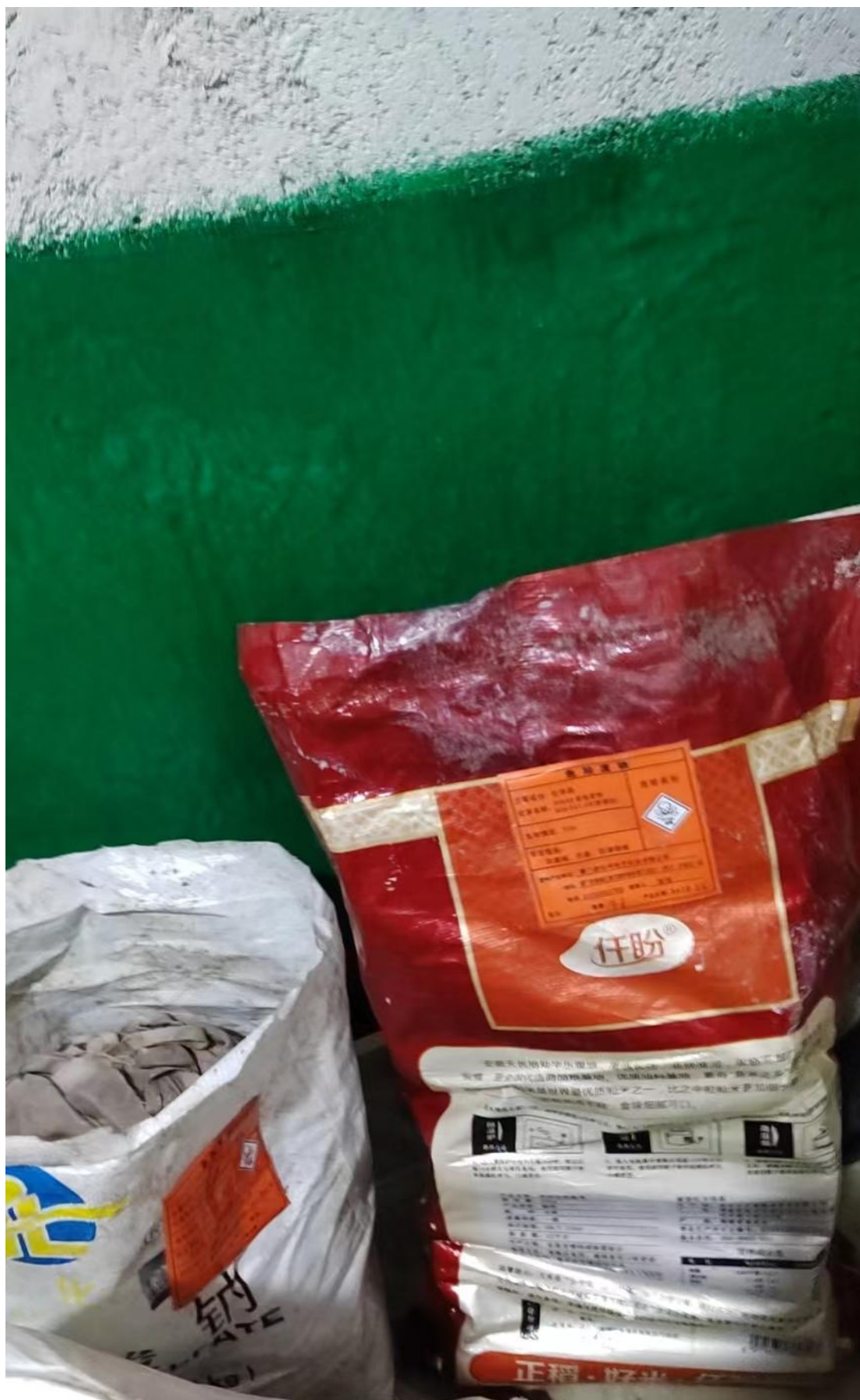
已完善袋装危险废物小标识