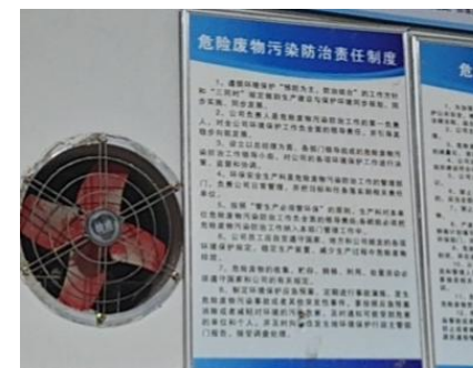
污染防治责任制度