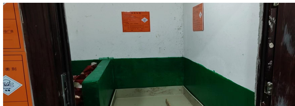
对危险废物进行分类收集贮存，规范使用危险废物标识。