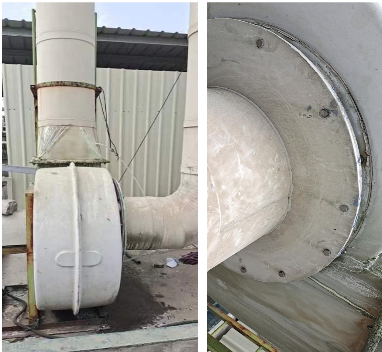
已完善喷淋塔运行管理

整改后: ①喷淋塔已进行整改, 加强废气处理设施运行管理, 杜绝跑冒滴漏。②完善废气处理设施运行台帐。