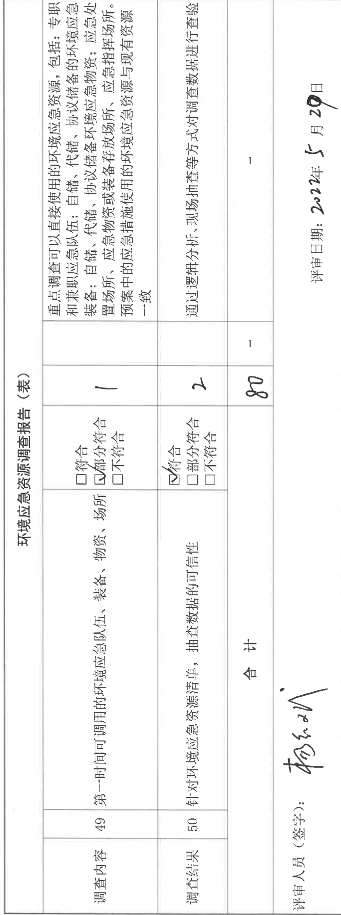
环境应急资源调查报告 (表)

注: 1. 符合, 指的是评审专家判定某一项指标所涉及的内容能够反映制定环境应急预案的企业开展了该项工作, 且工作全面、深入、质量高; 部分符合, 指的是评审专家判定企业开展了该项工作, 但工作不全面、不深入或质量不高; 不符合, 指的是评审人员判定企业未开展该项工作, 或工作有重大疏漏、流于形式或质量差。